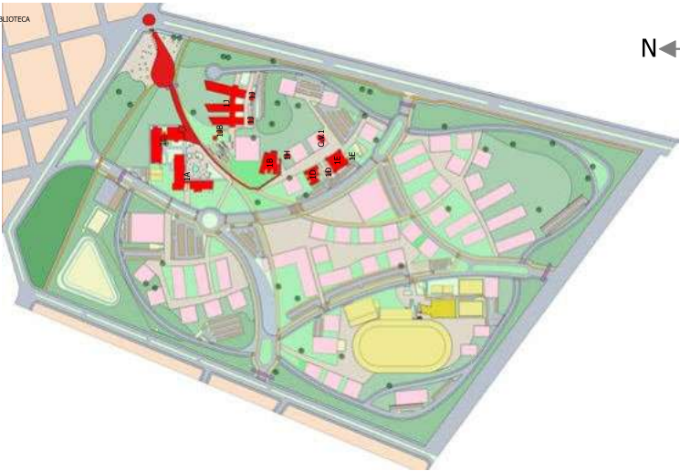
IMPLANTAÇÃO CAMPUS PONTAL