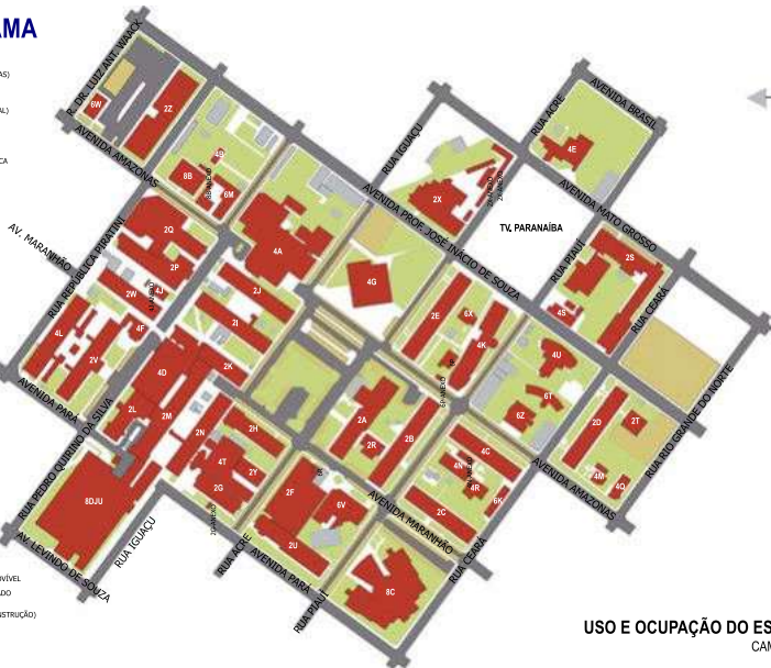
USO E OCUPAÇÃO DO ESPAÇO FÍSICO CAMPUS UMUARAMA