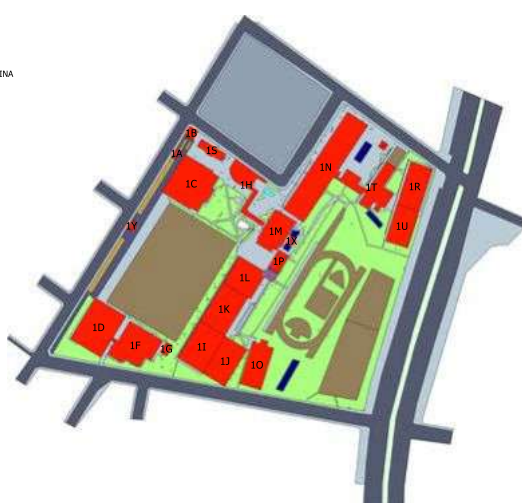
USO E OCUPAÇÃO DO ESPAÇO FÍSICO CAMPUS EDUCA